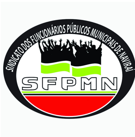
Imagem Digital da Marca

A eventual deformação desta imagem, com relação à constante do arquivo originalmente anexado, terá sido resultado da necessária adequação aos padrões requisitados para a publicação da marca na RPI. Assim, a imagem ao lado corresponde ao sinal que efetivamente será objeto de exame e publicação, ressalvada a hipótese de substituição da referida imagem decorrente de exigência formal.